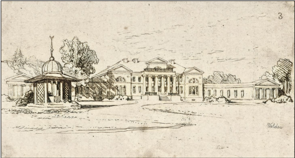
Elizabeth Rigby joonistus Valtu mõisa peahoonest (umbes 1838)

Reisiraamatus leidub Rigby joonistusi Valtu mõisa peahoonest ja lambatallist ning ka elanikest-töötajatest. Valtu mõis paistis eeskujuliku karjakasvatuse tõttu silma, milleks ehitati avarad laudad toskaana kapiteelidega sammasteridadega. Lambatallil oli pseudogooti välisilme. Võib oletada, et E. Rigby joonistas talli selle arhitektuurilise silmapaistvuse tõttu.