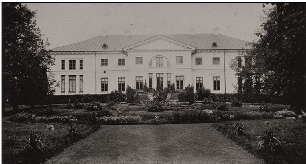
Valtu mõisa härrastemaja tagafassaad (1900).