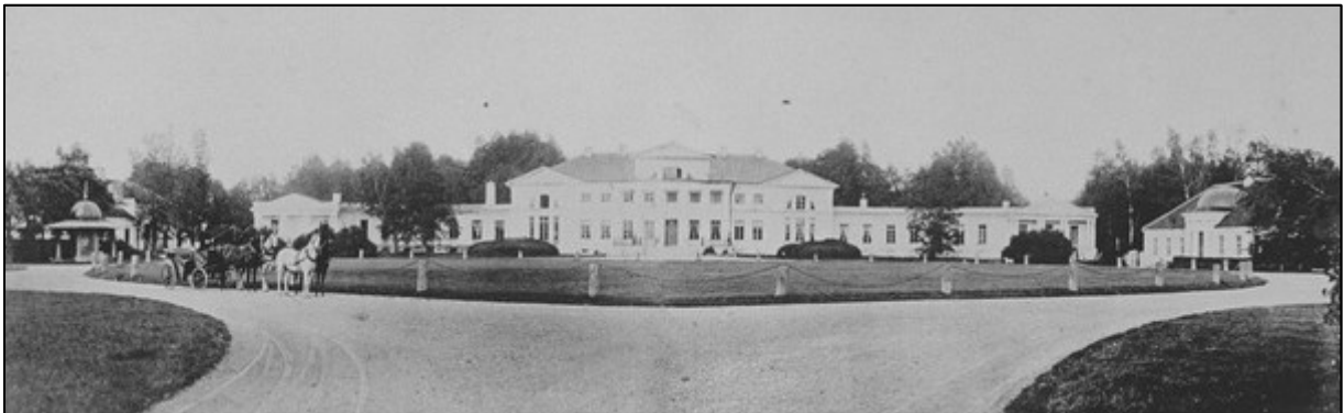
Peahoone koos teenijatemajade ning auringiga (1900). ERM Fk 887:360

Peahoone esist väljakut piirasid ühel küljel teenijatemaja, sõiduhobuste tall ja tõllakuur ning teisel küljel teenijatemaja, kuivati ja ait. Avara auhoovi keskel oli ringkujuline muruväljak, mida ümbritses ringtee. Teatud reservatsiooniga võib ringteed juba 18. sajandisse dateerida. Kaevu kohal oli kuplihoonena kavandatud paviljon. Sisepääs väljakule oli orienteeritud mõisa keskteljele. 10