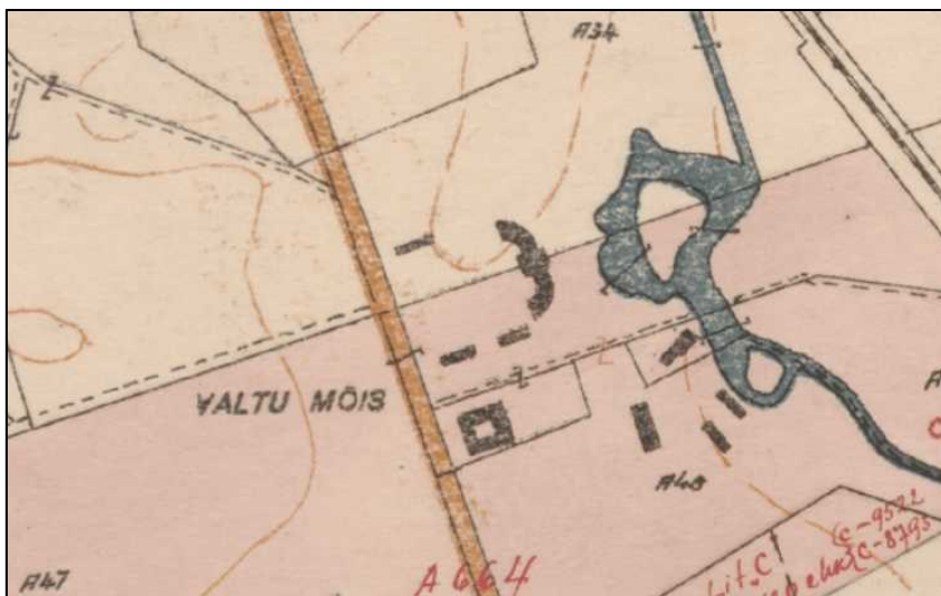
Valtu mõisasüda 1935. aasta katastrikaardil